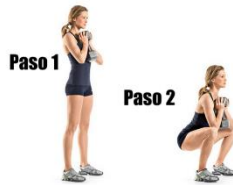
Pulso en Ejercicio